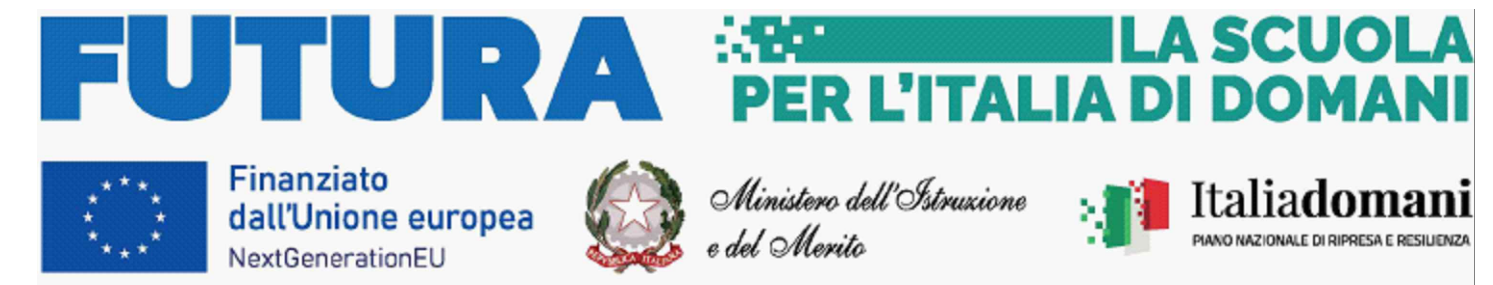
AREA OGGETTO DI INTERVENTO