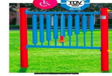
Xilofono o similare