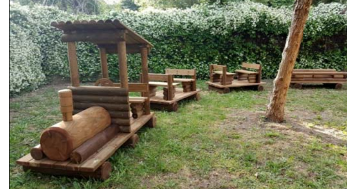
Locomotiva e vagoni o similare

24 - Scivolo su pavimento antitrauma inserito in progetto