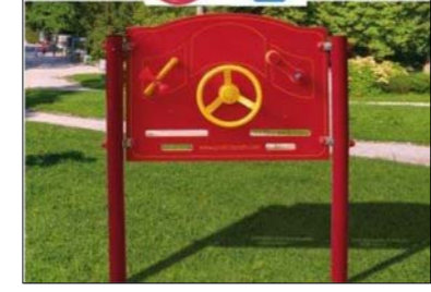
Auto o similare